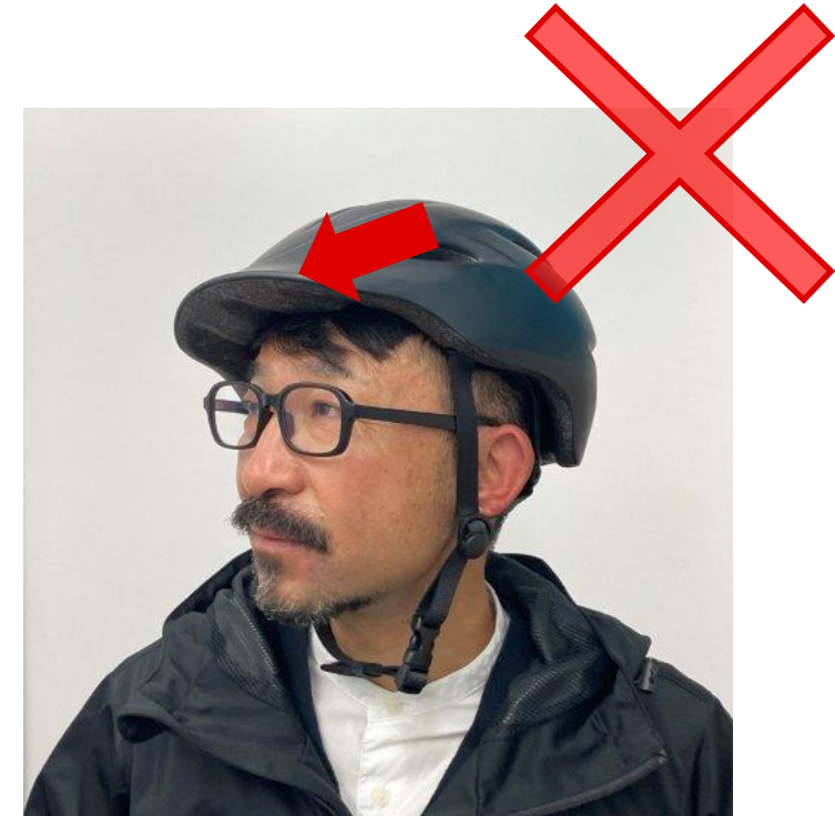
斜めにかぶっている