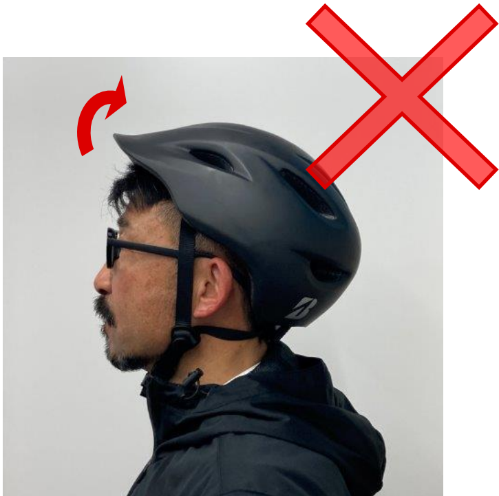
おでこを出してかぶってしまう